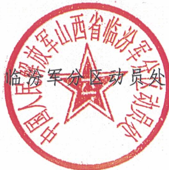
临汾军分区动员处