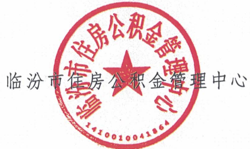
临汾市住房公积金管理中心