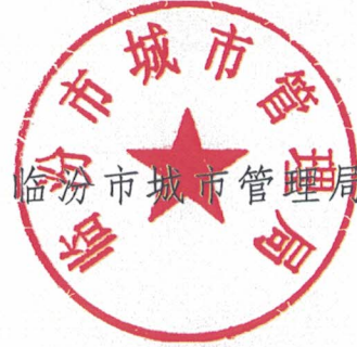
临汾市城市管理局